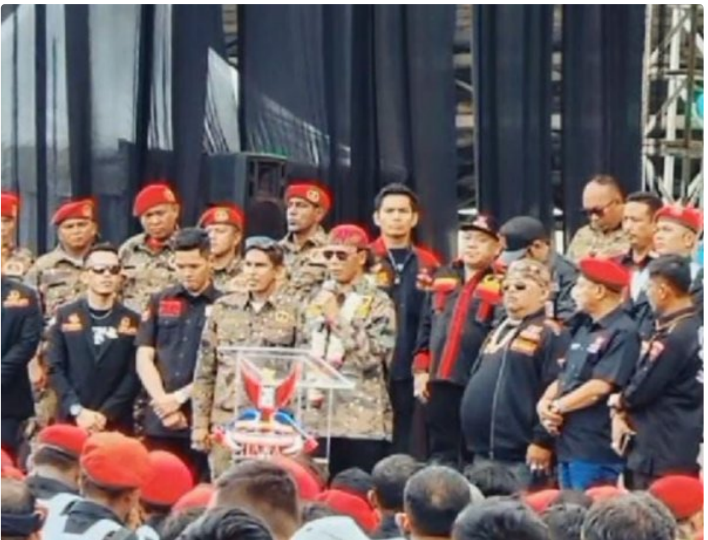
Foto: Saat Puluhan Ribu Anggota Gerakan Rakyat Indonesia Bersatu Jaya (GRIB Jaya) Membanjiri Gedung DPR-MPR RI Untuk Memastikan Kelancaran Acara Pelantikan Presiden Prabowo Subianto dan Wakil Presiden Gibran Rakabuming Raka. Minggu (20/010/2024).

JAKARTA - Dalam momen bersejarah pelantikan Presiden Prabowo Subianto dan Wakil Presiden Gibran Rakabuming Raka, puluhan ribu anggota Gerakan Rakyat